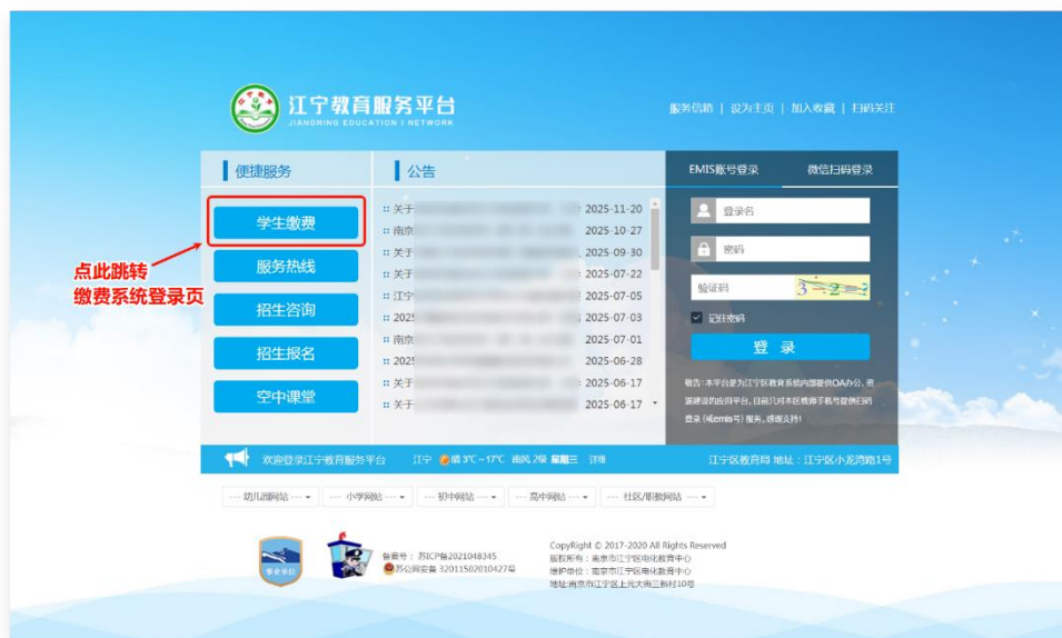
图 3-1 学生缴费入口