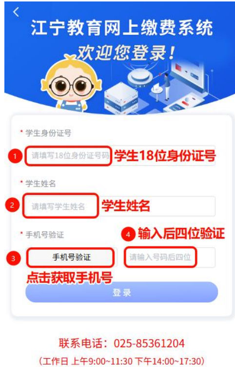
图 2-2 移动端登录