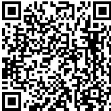
图 2-1 学生移动端登录页